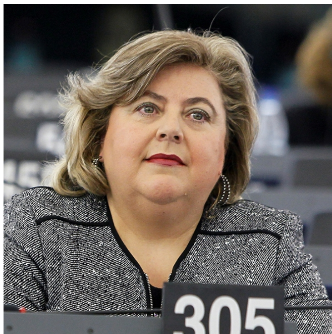
La eurodiputada socialista Clara Aguilera