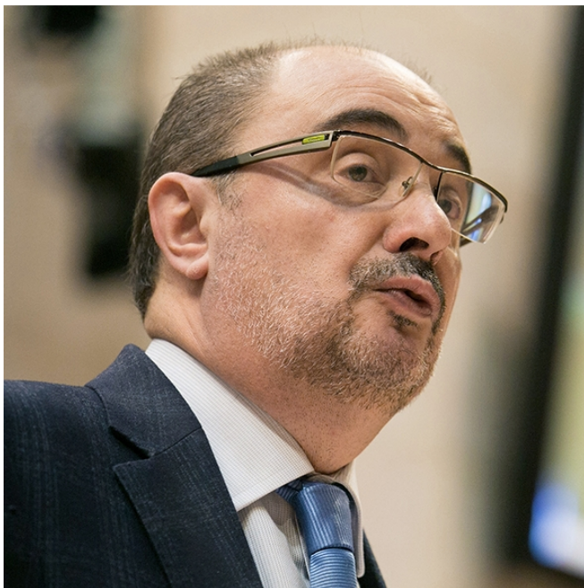
El presidente de Aragón, Javier Lambán