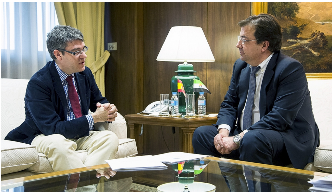
El ministro Álvaro Nadal (i), y el presidente de la Junta de Extremadura, Guillermo Fernández Vara (c)