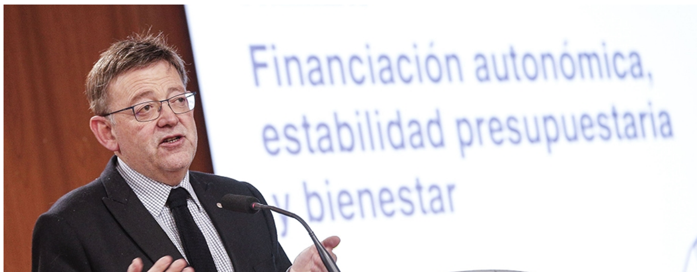
El president de la Generalitat, Ximo Puig