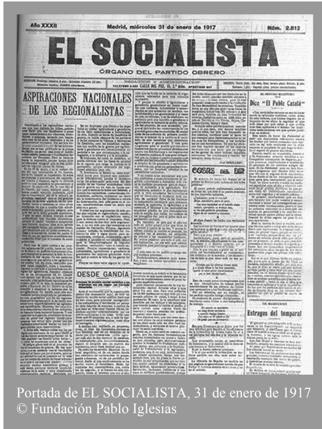
Portada de EL SOCIALISTA, 31 de enero de 1917